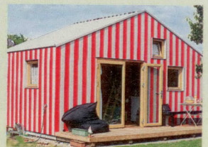
24 qm CaLa mit Bad, Wohn- und Geräteraum, je nach Ausstattung 15 000 bis 40 000 Euro

le und Wetterschutzfolie zwischen den Wänden. So hält sich die Wärme bei kälterem Wetter auch ohne Heizung.