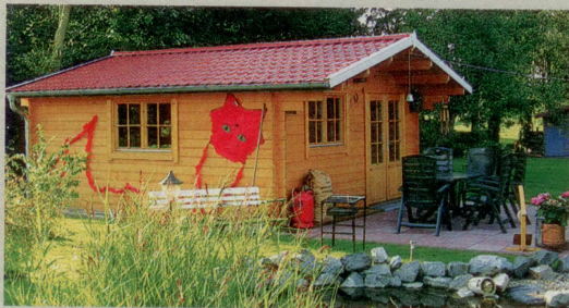
Blockhaus Modell Daniel (24 qm) von blockhaus-24.de , ohne Dachbelag/Fußboden/Montage, ab 2 995 Euro