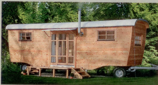
Wohnwagen (ab 23 qm) Mit Klappterrasse und Erker sowie winterfest isoliert ab 30 000 Euro bei wohlmwagen.de