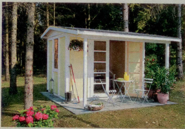
Nordisch Schwedenhaus (7,5 qm), schwoerer-gartenhaus.de inkl. Dacheindeckung, Fußboden, Farbe, ohne Montage ab 3 300 Euro